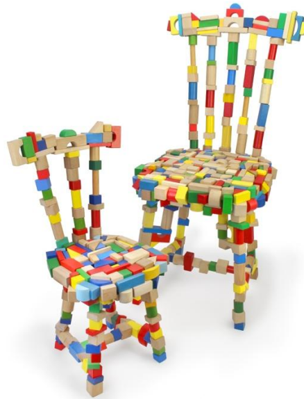
Links: functionele sculptuur van Gert Wessels, rechts: stoelen van Pepe Heykoop voor IKONIC