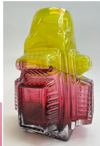
Links: gekleurde krukjes van Structural-aspect, midden: samenwerking Aesthetic Studios en Martijntje Cornelia, rechts glaswerk van Hans Muller