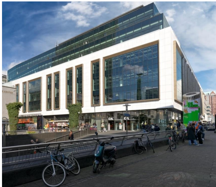
Links: 3D object van Amina Zemouli, rechts: het huidige AIR, aan het begin van de Rotterdamse Koopgoot