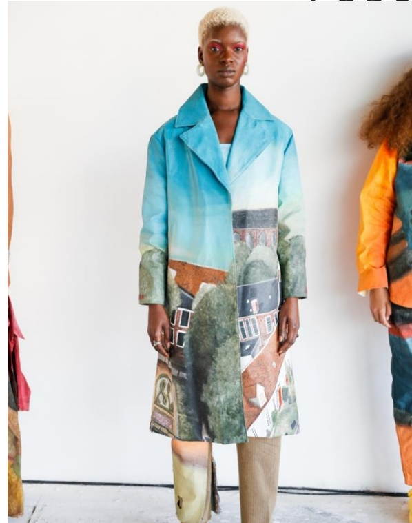
Links: kunstobject van Elisa Uberti, rechts: modecollectie van FEEV The Label