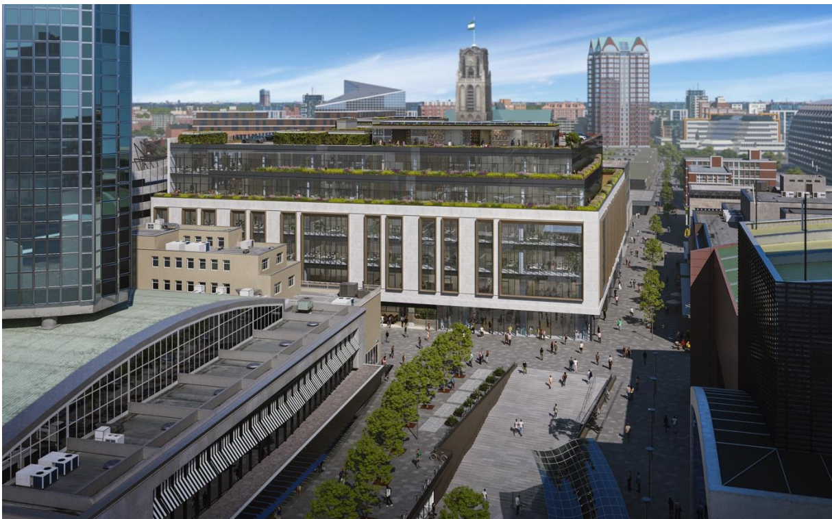
Het huidige AIR, aan het begin van de Rotterdamse Koopgoot

De V&D werd in 1947 ontworpen door architectenbureau Kraaijvanger en was een schoolvoorbeeld van de Rotterdamse wederopbouw architectuur. In de jaren erna heeft de gevel van het pand vele gedaanteverwisselingen ondergaan, maar hield het altijd de functie van warehouse. Afgelopen jaren is het markante gebouw echter door WOMO Architects volledig verduurzaamd en getransformeerd tot AIR: een multifunctionele plek voor werken, winkelen, ontmoeten en ontspannen. Het pand is verbouwd onder leiding van ontwikkelcombinatie NEOO en Schroders Capital. De winkels en publieke fietsenstalling onder het gebouw zijn al geopend en de kantoren zijn deels in gebruik door Spaces.