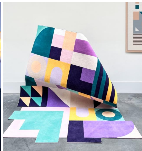
Links: lichtontwerp van APTUM by Ontwerpduo, rechts: grafische prints in textiel van Kars+Boom