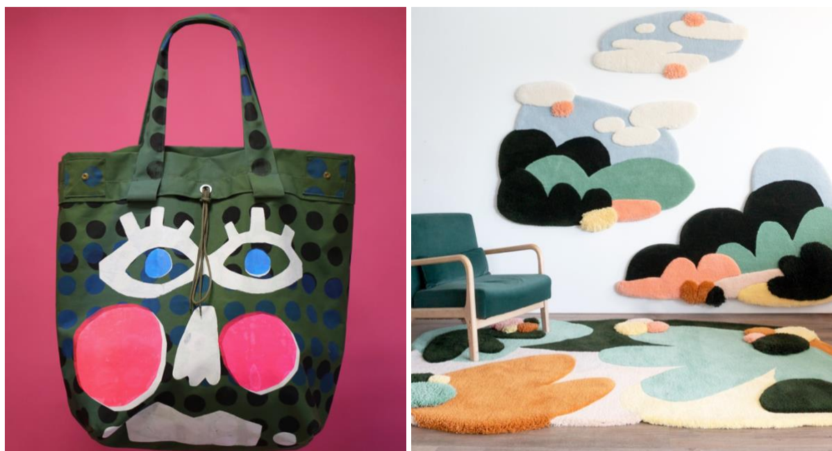
Links: tas van DIED, rechts: textielontwerp van Studio Mirte