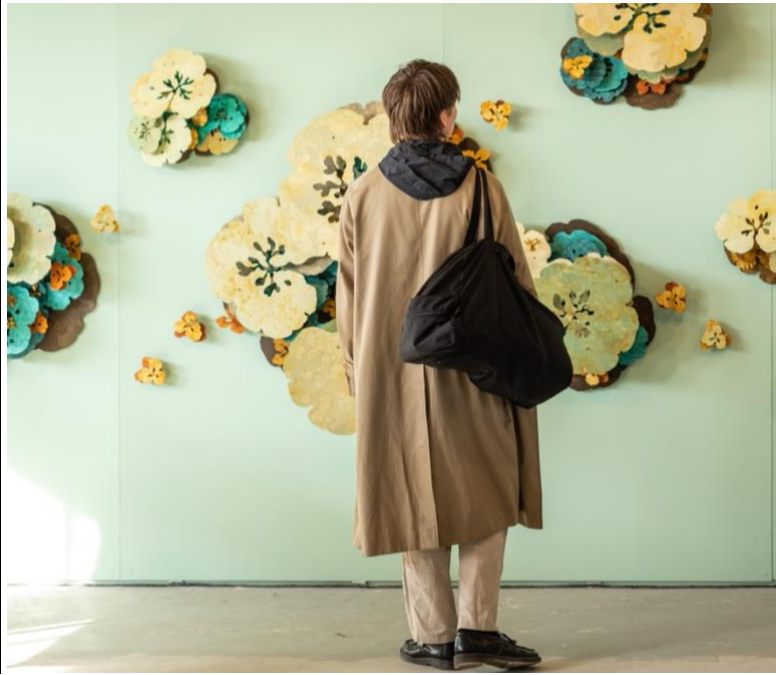
Links: lichtsculptuur van Bram Ellens via PLAY room, rechts: wandobjecten van Joris Kuipers