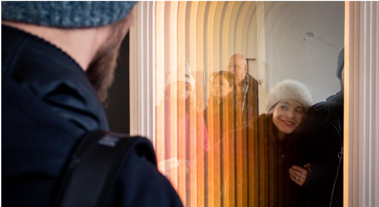
Spiegelinstallatie van OSSO

Terwijl nieuwe technologie design in haar greep heeft, omarmen veel jonge ontwerpers nog steeds het ambacht. Zo is textiel aan een stevige opmars bezig, wat zich vertaalt in vakkundig geweven kleden maar ook in alledaagse producten met een bijzonder jasje. De mogelijkheden van keramiek worden op allerlei manieren onderzocht en opgerekt en dat zie je terug in enorme objecten van aardewerk. Hoewel duurzaamheid onder designers inmiddels een vanzelfsprekendheid is geworden, vormt de natuur nog steeds een grote inspiratiebron. Hout wordt veelvuldig toegepast, in puntgave meubels maar ook aandoenlijke robots en eigentijdse wandelstokken.