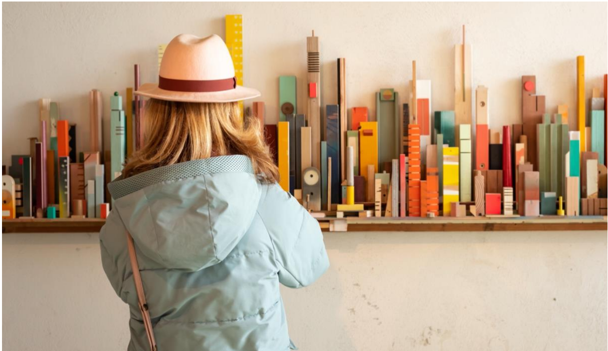
Werk van Floris Hovers via Gallery Untitled

Het eerste weekend van februari strijkt OBJECT opnieuw neer in het monumentale HAKA-gebouw in Rotterdam. Het pand vormt de poort tot het bruisende Vierhavensgebied waar tientallen designers zijn gevestigd. Er zitten talloze creatieve initiatieven om de hoek en bezoekers van de beurs zijn welkom in verschillende ontwerpstudio's.