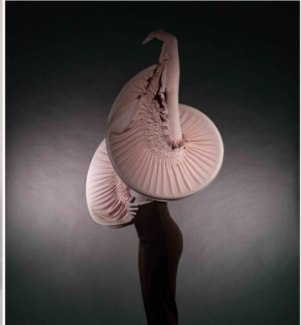
Links: monumentale spiegel van Van Erp Objects, rechts: sculpturale mode van Fauh