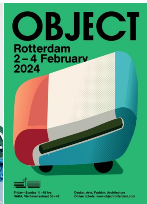
Links: interieurobjecten van studio mo man tai, rechts: campagnebeeld OBJECT door Dirk Laucke