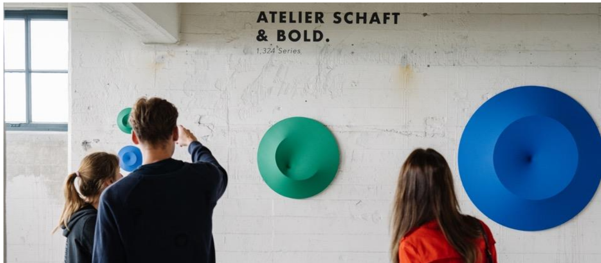
Driedimensionale wandobjecten van Atelier Schaft & Bold.