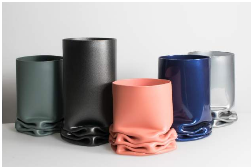
V.l.n.r.: Vij5, Tim Teven Studio