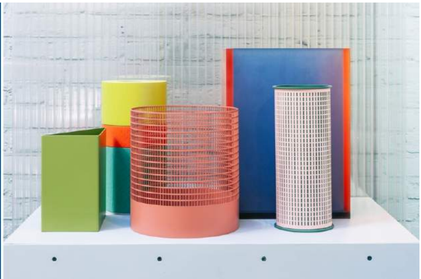
V.l.n.r.: OBJECT Rotterdam 2019, Raw Color